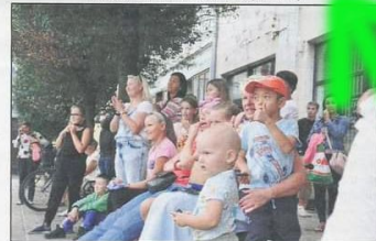
Zachwycały się i dzieci, i dorośli