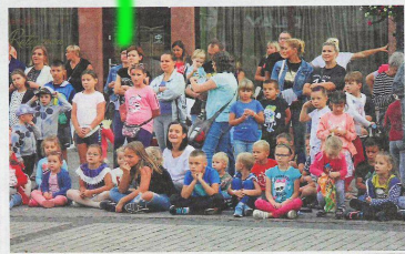
PH. M. LASKY