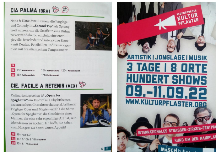
Kulturpflaster, Regensburg, Germany - 2022