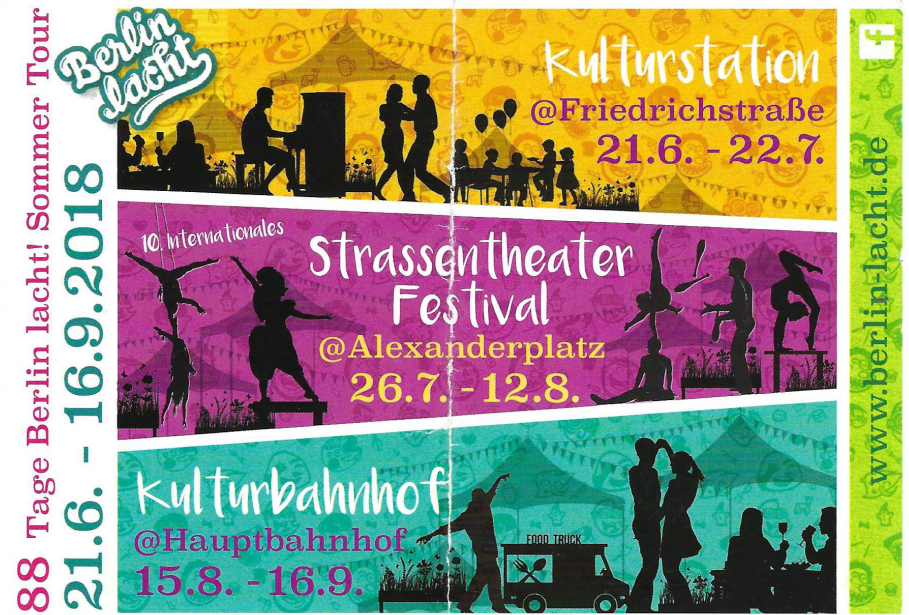
Berlin Lacht, Berlin, Germany - 2018