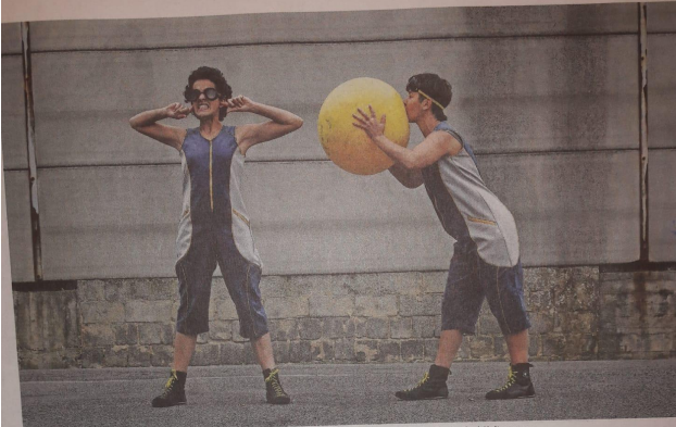
Achtung, gleich platzt er! Was man mit Bällen alles machen kann, führt die Compania Palma beim Straßenfestival-Kultur vor.