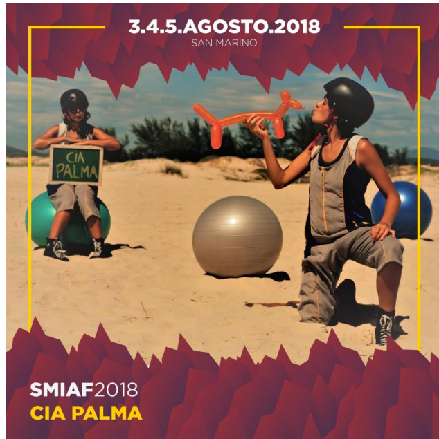
San Marino International Arts Festival - SMIAF, San Marino - 2018