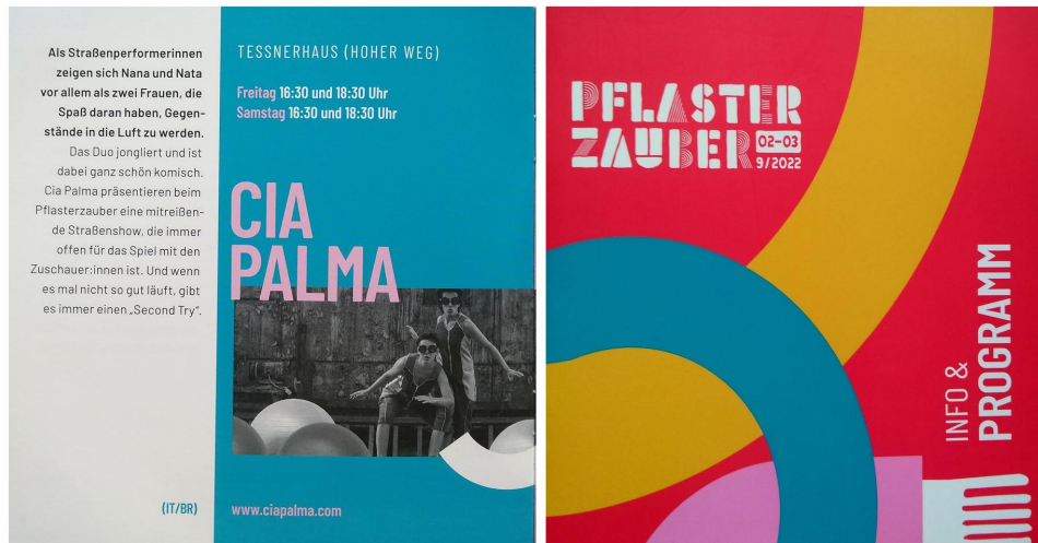
PflasterZauber Internationales Zirkus Theater Tanz Festival, Hildesheim, Germany - 2022