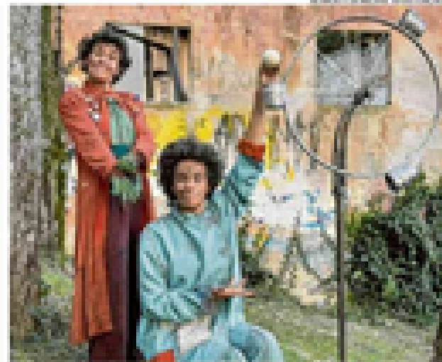
Artistas fazem apresentações gratuitas em espaços públicos do RS

De forma política e crítica, a peça propõe outras maneiras de viver o mundo, repensando hábitos e relações com o consumo. Veja a agenda completa em gph.digital.julianabublitz.com